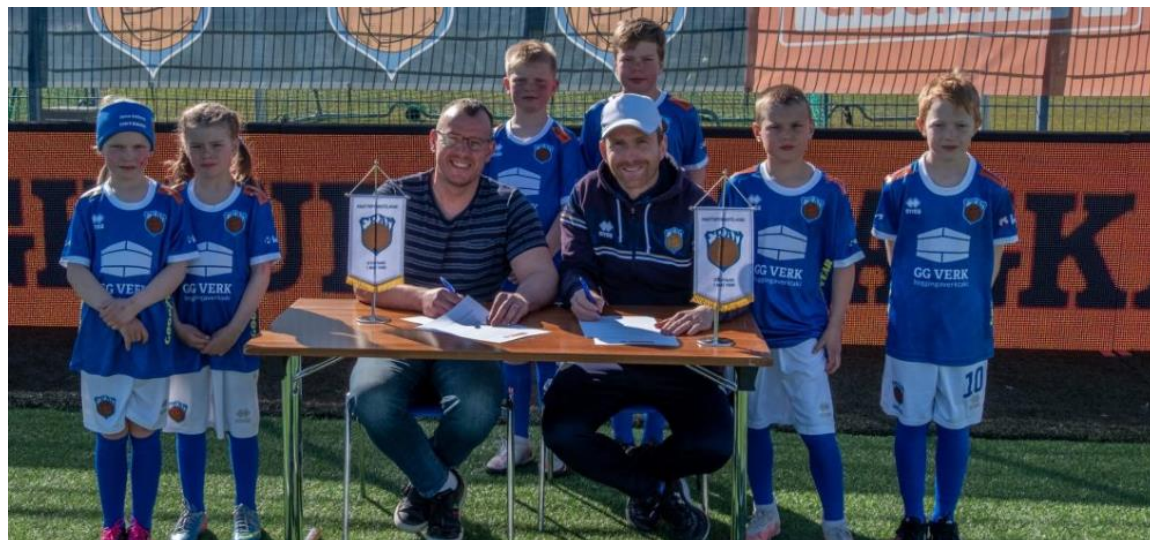
Fram og Hagkaup í samstarf

Hagkaup styður við fjölbreytt verkefni sem efla samfélagið og vernda umhverfið. Styrkirnir renna til félagasamtaka og fyrirtækja sem stuðla að jákvæðri samfélagsþróun. Dæmi um verkefni sem Hagkaup hefur styrkt á síðustu misserum eru styrkir til íþróttafélaga, góðgerðamála, menningar- og æskulýðsstarfa. Þá styður Hagkaup reglulega hin ýmsu verkefni með því að selja styrktarvörur fyrir góðgerðarfélög án þess að taka hagnað af sölu, t.d. Mottumarssokka, Bleiku slaufuna og dagatal Slökkviliðsins.