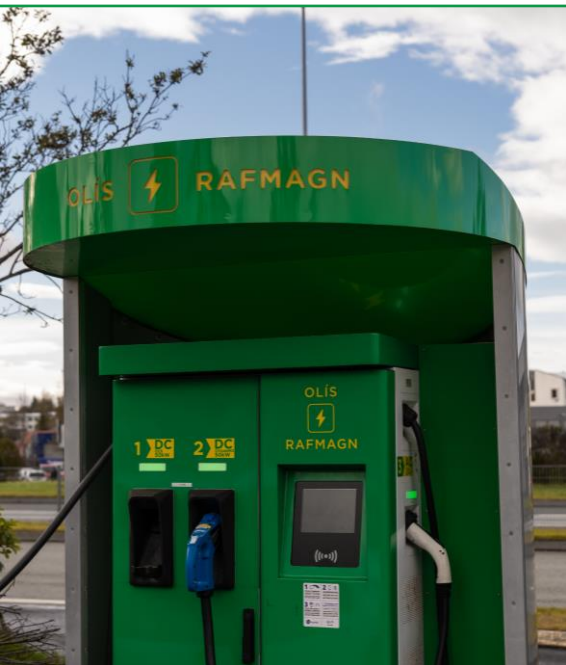
Rafhleðslustöð á Olís Álfheimum