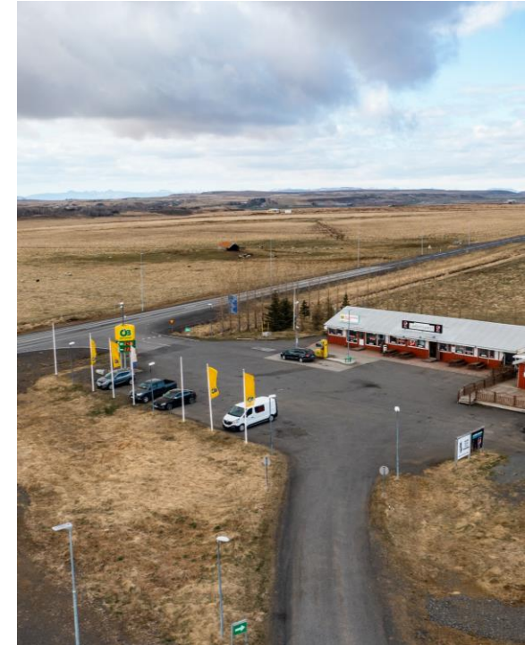
ÓB stöð við Landvegamót

Við leggjum áherslu á að fara í einu og öllu eftir lögum og reglum í starfsemi okkar með gagnsæi og siðgæði að leiðarljósi. Sala á jarðefnaeldsneyti er háð lögum og reglum um losun gróðurhúsalofttegunda og við blöndum endurnýjanlegu eldsneyti (ethanol í bensín, biodisel í diselólíu) saman við hefðbundið eldsneyti til að uppfylla lög og reglur um minni losun gróðurhúsalofttegunda. Olís starfar eftir og uppfyllir reglugerð um gæði eldsneytis en markmið þeirrar reglugerðar er að draga úr losun gróðurhúsalofttegunda á vistferli eldsneytis og hugsanlegum skaðlegum áhrifum eldsneytis á heilsu fólks og umhverfisins.