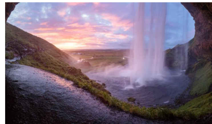
Seljalandsfoss að sumarlagi