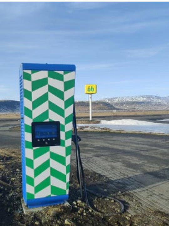
Rafhleðslustöð á ÓB Kirkjubæjarklaustri